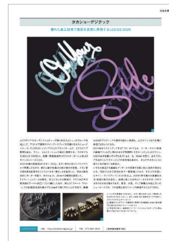
誌面掲載イメージ(1P)

※「id+」には、誌面に掲載した画像・文章に加え、ご提供いただく動画1点の掲載が可能です。 ※お申込みをいただいた順に取材日時を決めさせていただきます。取材が混みあうことが予想されますのでお早めのお申込みをお勧めします。 ※取材の際には、ZoomなどのWEB会議サービスを利用する場合があります。 ※別途消費税がかかります。