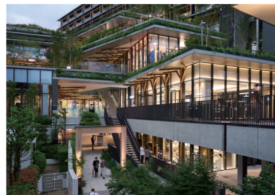
WITH HARAJUKU (『商店建築』2020年9月号掲載)