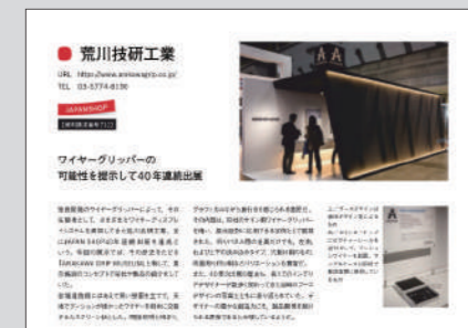
掲載イメージ(1/2ページ)