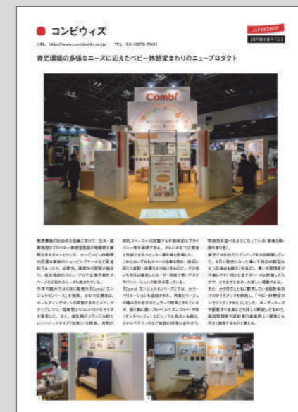
掲載イメージ(1ページ)