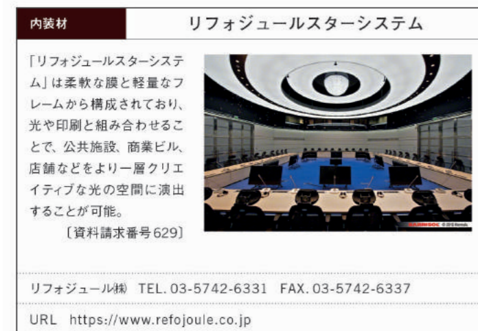
誌面掲載フォーマット例(実寸)