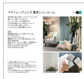
掲載イメージ(1/2ページ)