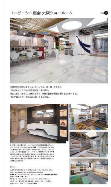
掲載イメージ(1ページ)

壁材：シート/パネル/タイル/レンガ/漆喰/左官材/塗装/化粧板 床材：フローリング/タイル/シート/カーペット/畳 装飾材：オーナメント/モールディング/特殊塗装/ファブリック/装飾金物/組子 建築金物：ドアノブ/レバーハンドル/ヒンジ/スイッチプレート 透明素材：ガラス/アクリル/和紙/メッシュ/パンチングメタル 店舗設備：ディスプレイ/空調設備/防犯設備/建築照明/演出照明/サイン/厨房設備 環境演出：音響/映像/水景演出/グリーン/プランター ほか