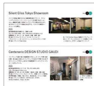
掲載イメージ(1/4ページ)