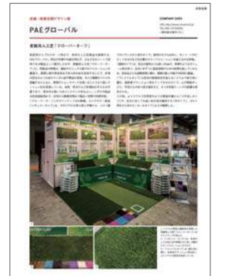
掲載イメージ(1ページ)

2018年11月20日~22日に東京ビッグサイトで開催される「Japan Home & Building Show 2018」「S-design 店舗・商業空間デザイン展2018」に出展される企業を対象にした誌上プレゼンテーションを実施します。展示会中にブースを取材し、展示製品やサービス、ブースの様子を記事形式で掲載します。展示会後に誌面化することで、来場者に出展内容を再認知させ、出展効果を高めることができます。詳細は別紙企画書をご参照ください。