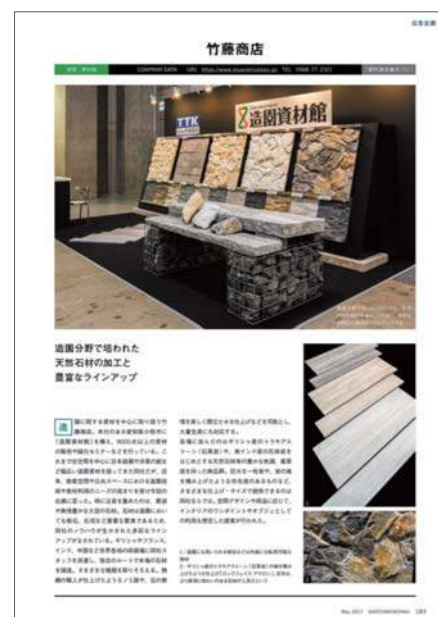
※掲載イメージ(カラー1P)

*写真撮影、取材、原稿作成含む *写真やテキストの著作権は商店建築社に帰属します