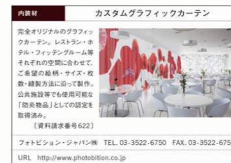
誌面掲載フォーマット例