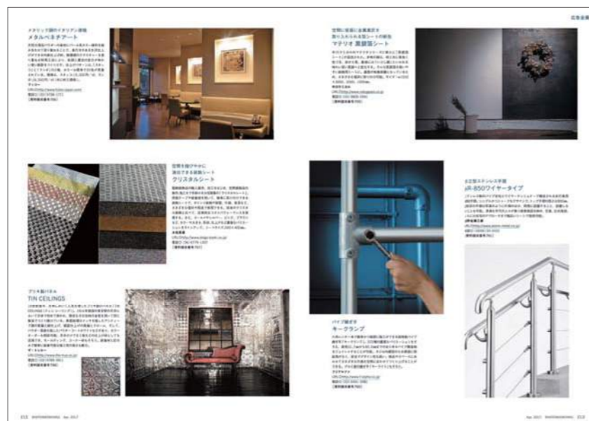
誌面掲載イメージ