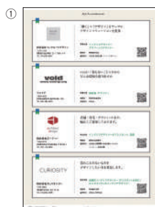
(1/4P サイズ求人広告掲載例)