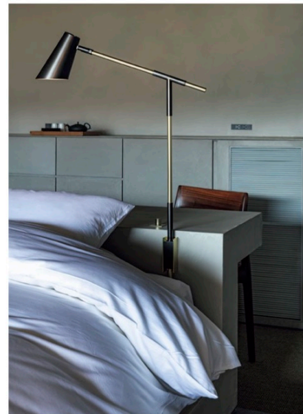
ヘッドボードから立ち上がるベッドサイドライト。首の主軸を回転させることで、デスクライトとしても機能する。首のパーツは、基調色がグレーの客室ではコッパーを、ベージュの客室では真鍮を採用している

(客室) 床: 合板下地磁器質タイルt10乱貼り (マリスト セリエストーン、マリスト ボートレイトマット/アペルコ) モルタル下地サイザルカーペットt7敷き (BE563/アイオーシー) 二重床システム (万協フロア/万協) の上緑なし和紙畳t30敷き (大建工業) 壁: LGS組みケイカル板下地マリスト貼り LGS組みPB下地AEP (ポーターズペイント) 天井: LGS組みPB下地AEP (ポーターズペイント) 木板w30 t15日達かし貼り (ティンパクルー) 浴室/LGS組みセメント板貼り (アクアパネル/チヨダウチ) NAD 什器: 木工下地マリストt9乱貼り 特殊セメントモルタル仕上げ (モラト/フッコ) ST.PLリン酸処理 素材材板貼り+ST.PL真鍮メッキ塗装 照明器具: 特注照明、調光スイッチ/銅メッキ、真鍮メッキ、黒皮塗装