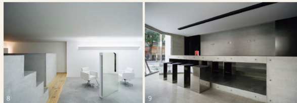
8. 柳原照弘さんと永富裕幸さんが初めて協働した美容室「ne」(2010年) 9. 和菓子店「餅匠しづく 大阪新町店」(2008年)では、壁際と共に店内中央にスリット照明を設けているが、存在感を感じさせない意匠が施されている

特注照明の制作は、納期も課題となる。器具のイメージや個数を計画の初期段階から共有しておくことが重要だ。永富さんは、「今回のような