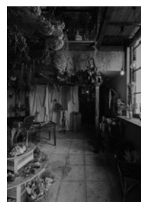
2020.7 Vol.65 No.7 表紙写真/ボタニコ(P.99)

STAFF 編集長/塩田健一 副編集長/車田 創 編集/伊藤梨香 柴崎慎大 平田 悠 村上桂英 金子紗希 DTPデザイン/宇澤佑佳(SOY) 広告/三木亨寿 田村裕樹 岡野充宏 小杉匡弘 雨宮 諒 販売/工藤仁樹 山脇大輔 愛読者係/関根裕子 経理/村上琴里 支社/武村知秋(広告) アート・ディレクション/BOOTLEG レイアウトデザイン/BOOTLEG + 宇澤佑佳 印刷/図書印刷株式会社