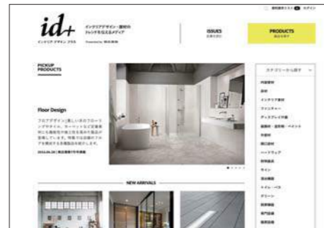
2 プロダクト一覧から該当の CATEGORY を選択