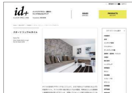
4 製品を選択すると製品の詳細情報が表示されます

月刊商店建築 2018年4月号 広告企画 「店舗建材・設備ガイド 2018 / 春」