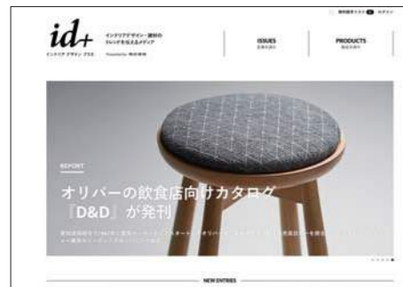
1 トップページ「PRODUCTS」をクリック

〈id+(インテリアデザインプラス) 掲載例〉 https://www.shotenkenchiku-plus.com/